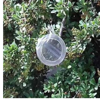
شكل 1. الأقفاص المثبتة على الأشجار المصابة. Figure 1. Fixed cages on infected trees.

وُحفظت في المجمدة عند حرارة -4^{\circ}\text{C} . تم أخذ القراءات البيومترية للعينات بوساطة مكبرة من نوع Olympus (SZ61-Japan-WD38) وعلى عدسة مدرجة وبقوة تكبير مختلفة، وُعدلت كافة القراءات إلى المليمتر. تم تصنيف العينات المدروسة اعتماداً على مفاتيح التصنيف المعتمدة للجنس Stephanitis sp. (Hurd, 1945؛ Guilbert, 2007) (Lee, 1969).